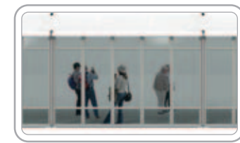
Glass Panel ألواح زجاجية