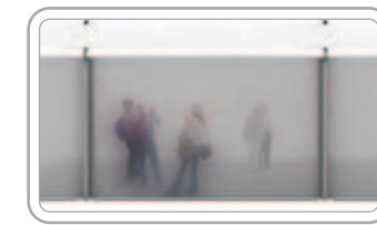
Clear PVC بلاستيك شفاف