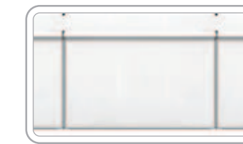
Plain PVC PVC بلاستيك سادة