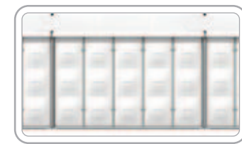
ABS Panel ألواح ABS