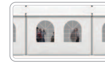
French Window-Style B شبابيك فرنسية - ب