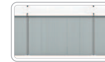
Sandwich Panel الألواح العازلة