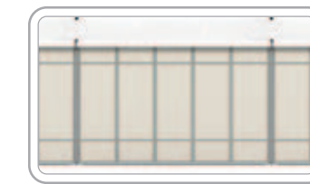
Hard PVC بلاستيك صلب