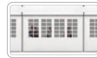
French Window-Style A شبابيك فرنسية - أ